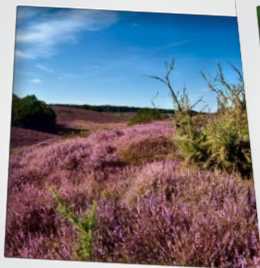
Op de hei