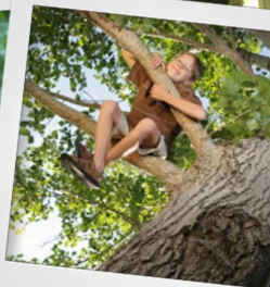
Lekker in de bomen klimmen